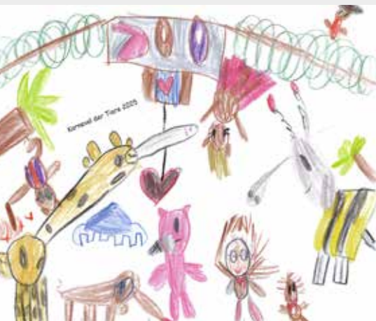
Aylin, 6 Jahre

Passend zur Namensgebung unseres Kindergartens „Arche Noah“ lautet unser diesjähriges Faschingsthema: „Der Karneval der Tiere“